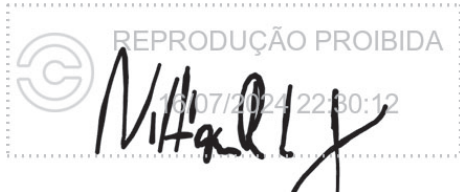
Nilton Ribeiro Luz Junior 16 jul 2024, 22-30-12.png

Assinatura manuscrita com hash SHA256 prefixo 765677(...)